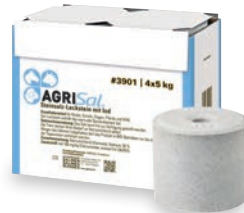
AgriSal® Steinsalz-Leckstein mit Jod #3901 5 kg

Gepresster, leicht gräulicher, zylindrischer Salz-Leckstein mit durchgehendem Loch in der Längsachse. Hergestellt aus Steinsalz, angereichert mit Jod.