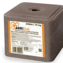
AgriSal® Mineral-Leckstein mit Spurenelementen #3904 10 kg

Der Stein eignet sich für Rinder, Schafe, Ziegen, Pferde und Wild. Auf der Weide und im Stall, für alle Tiere, die zur Ergänzung des täglich verabreichten Futters Salz benötigen. Das Salz kann frei zur Verfügung gestellt werden. Die Tiere decken ihren Bedarf an Natriumchlorid selber.