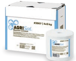
AgriSal® Meersalz-Leckstein #3907 5 kg

Der Stein eignet sich für Rinder, Schafe, Ziegen, Pferde und Wild. Auf der Weide und im Stall, für alle Tiere, die zur Ergänzung des täglich verabreichten Futters Salz benötigen. Das Salz kann frei zur Verfügung gestellt werden. Die Tiere decken ihren Bedarf an Natriumchlorid selber.