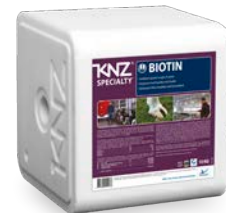
KNZ Biotin #3043 10kg

Gepresster, weisser Salz-Leckstein mit durchgehendem, mittigen Loch. Angereichert mit Magnesium, Zink, Kupfer, Jod, Selen und Biotin. Für gesunde Hufe und Klauen, unterstützt die Nervenzellen, den Stoffwechsel und die Muskelbildung.