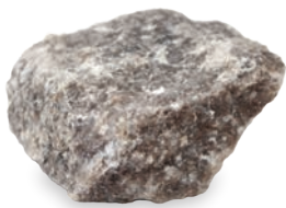
Naturleckstein Armenien #3021

Steinsalz-Brocken aus Armenien, grau, mit helleren und dunkleren Zonen verursacht durch mineralische Begleitsalze. Das Salz wird bergmännisch aus einer natürlichen Steinsalzlagerstätte abgebaut.