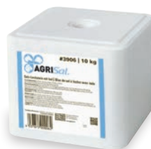
AgriSal® Siedesalz-Leckstein mit Jod #3906 10 kg

Gepresster, weisser Salz-Leckstein. Rechteckige Steinform mit durchgehendem Loch in der Mitte. Reines Siedesalz, angereichert mit Jod.