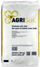
AgriSal® Viehsalz mit Jod #3154 25 kg #3153 50 kg

Natriumchlorid, das als Beigabe zum Raufutter zur Deckung des täglichen Natrium- und Jodbedarfs verwendet wird.