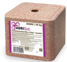
AgriSal® Fruchtbarkeits-Leckstein #3905 10 kg

Mineralfuttermittel für Rinder, Schafe, Ziegen, Pferde und Wild.