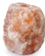
Naturleckstein Himalaya #3027

Geeignet für Rinder, Schafe, Ziegen, Pferde und Wild.