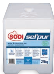
SEL'PUR Salins #3041 25kg

Weisser Salzleckstein aus reinem Salz mit mittigem Loch. Der Stein eignet sich für Rinder, Schafe und Ziegen. Die Tiere decken ihren Bedarf an Natriumchlorid selber.