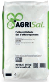
AgriSal® Futtermittelsalz #3482 25 kg #3481 50 kg

Natriumchlorid, das als Beigabe zum Raufutter zur Deckung des täglichen Natrium- und Jodbedarfs verwendet wird.