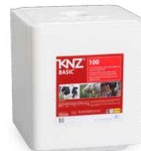
KNZ 100 Magnum - sel pur #3040 25kg

Gepresster, weisser Salz-Leckstein aus purem Salz mit einer Reinheit von 99,9% Natriumchlorid mit mittigem Loch. Unterstützt die Balance und das Gleichgewicht von Säuren und Flüssigkeiten im Organismus sowie die Funktion des zentralen Nervensystems, der Muskelkontraktion und die Darmflora.