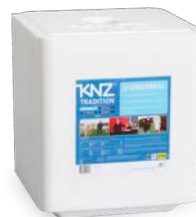
KNZ Tradition Universal Magnum #3042 25kg

Weisser Salzleckstein aus reinem Salz mit mittigem Loch. Der Stein eignet sich für Rinder, Schafe und Ziegen. Die Tiere decken ihren Bedarf an Natriumchlorid selber.